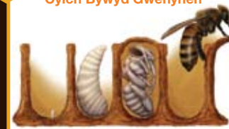
Wy Larfa Pwpa Oedolyn