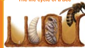
Egg Larva Pupa Adult