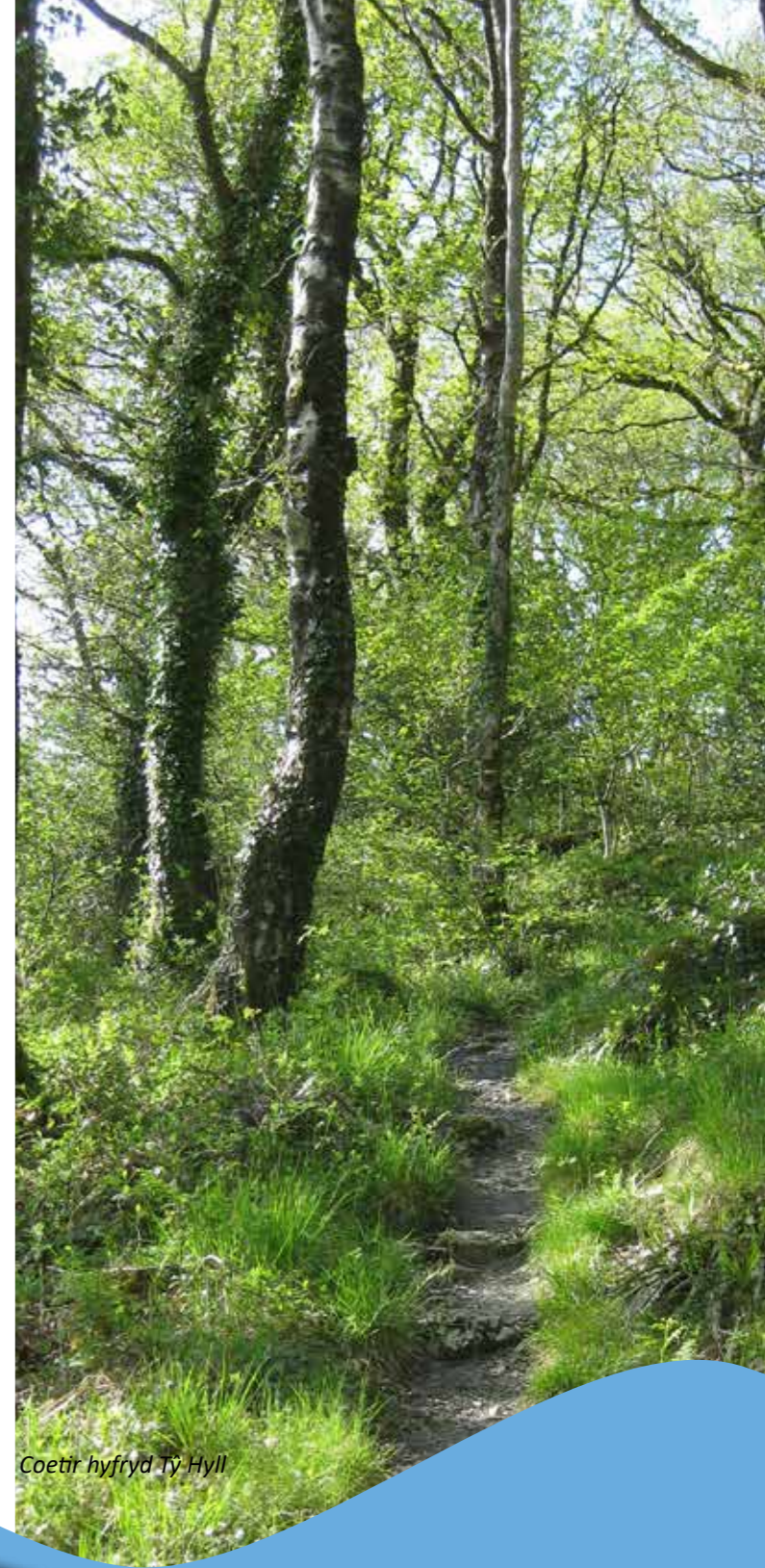
Coetir hyfryd Tŷ Hyll

Ym mis Medi '23 cynhaliwyd penwythnos Mentro a Dathlu unwaith eto. Daeth cyfanswm o 52 o bobl o bob oedran i Nant Gwynant am benwythnos llawn digwyddiadau gwirfoddoli, yn cynnwys creu blychau nythu i dyluanod, casglu sbwriel ar ganŵ, cynnal a chadw llwybrau, rheoli rhywogaethau ymledol a llawer mwy! Roedd y penwythnos yn gyfle gwych i dreulio amser yn mwynhau cynefinoedd a thirluniau arbennig Eryri tra'n helpu i'w gwarchod. Yn benodol, llwyddodd rhai o'n aelodau brwdfrydig sy'n byw cryn bellter i ffwrdd i gymryd rhan lawn yn ein gwaith cadwraeth