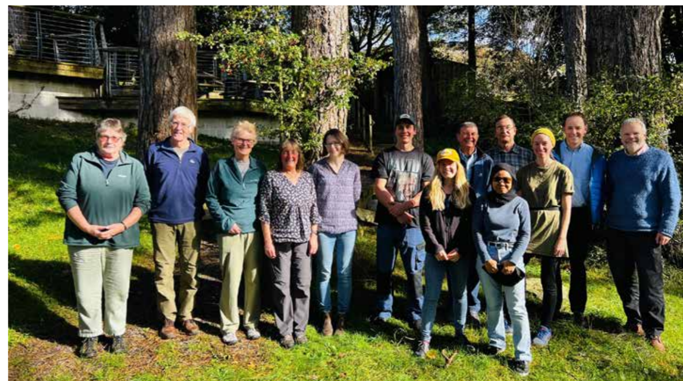
Ychydig o ymddiriedolwyr a staff Cymdeithas Eryri / Cymdeithas Eryri yn mwynhau'r haul