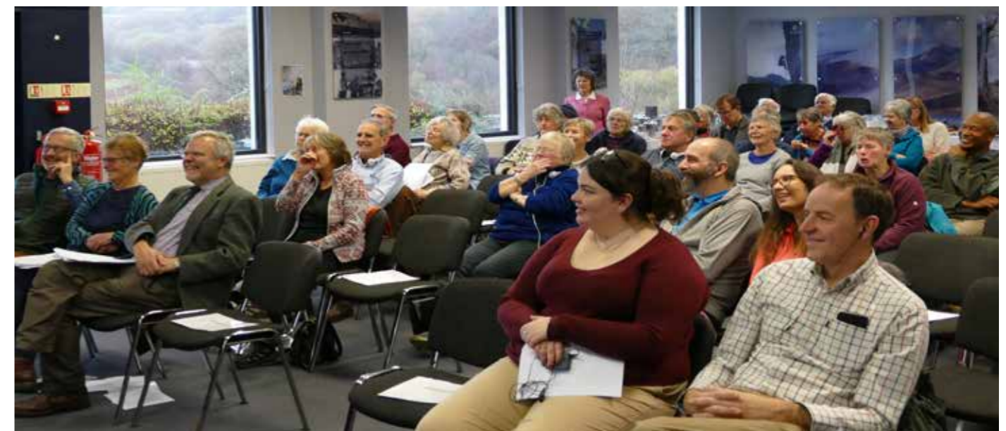
Ymddiriedolwyr, staff ac aelodau yn ein Cyfarfod Cyffredinol Blynnyddol 2023

Nodyn: Mae pob tudalen sy'n cynnwys gwybodaeth ariannol (tudalennau 19,20,23,24,25,26,27 a 29) mewn maint ffont llai oherwydd y cyfyngiadau ar ymyl y dudalen.