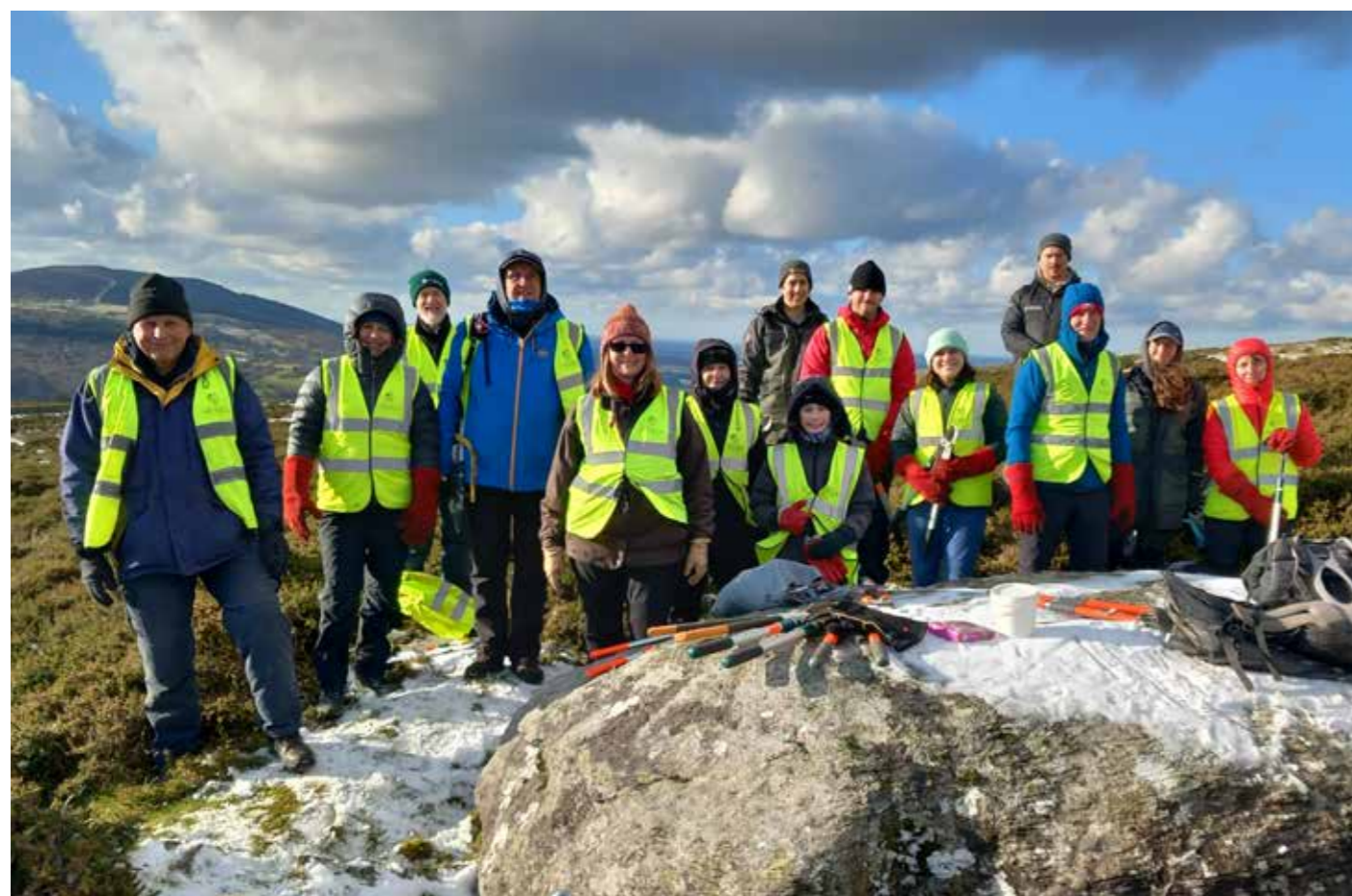
Gwirfoddolwyr allan ar y Carneddau yn clirio eithin o weddillion archeolegol hynafol

Listed investments are stated at market value as quoted on the UK Stock Exchange. Realised gains or losses from the sale of investments and unrealised gains or losses from revaluing them to current market value are included in the Statement of Financial Activities.